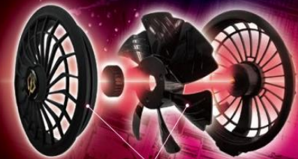
The blades can be removed and washed in water.