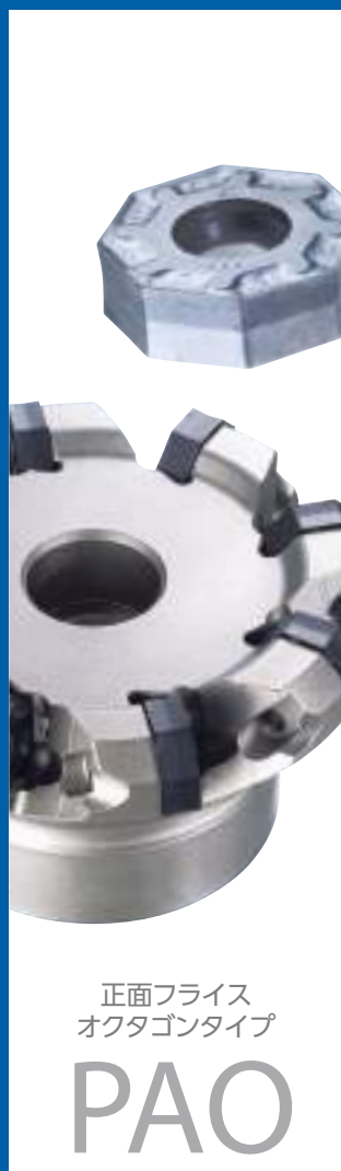
正面フライス オクタゴンタイプ